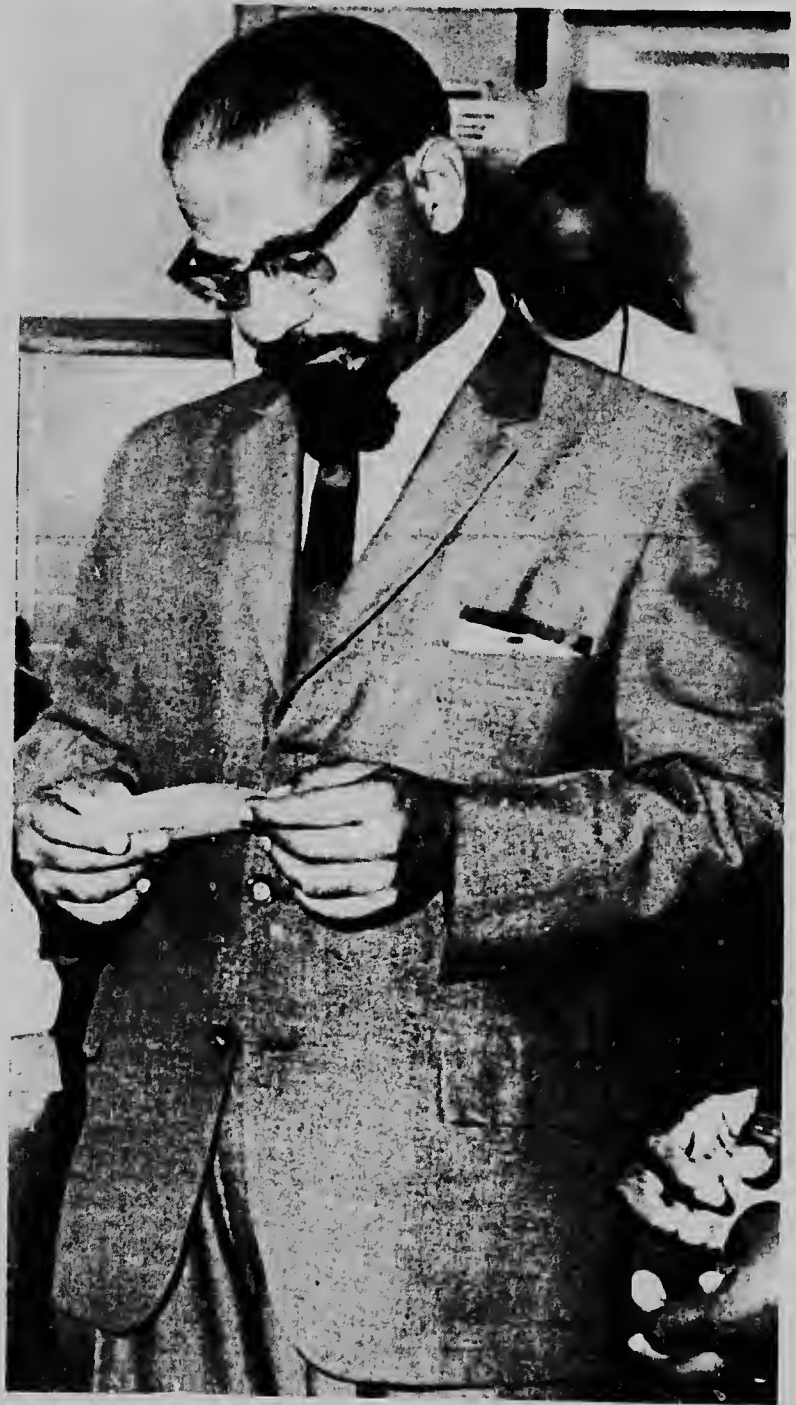
MR DR. M.F. DA COSTA GOMEZ

Segun nos a ser informa tabata e intencion pa ayera tardi traslada e restonan mortal di Mr. Dr. da Costa Gomez pa El Tributo caminda lo e keda te awe tardi ora yega e momento di entierro.